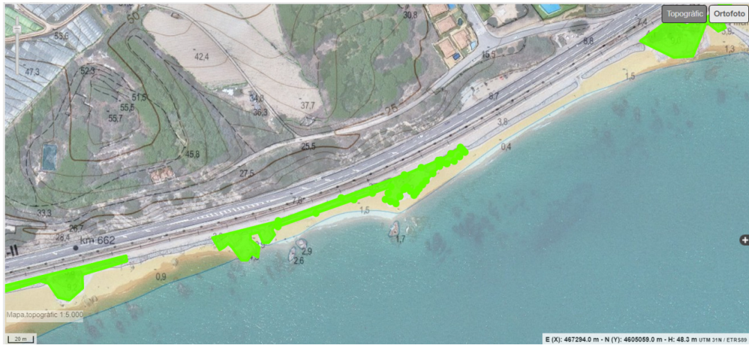
Plànol 4. Àmbit de naturalització de la platja.