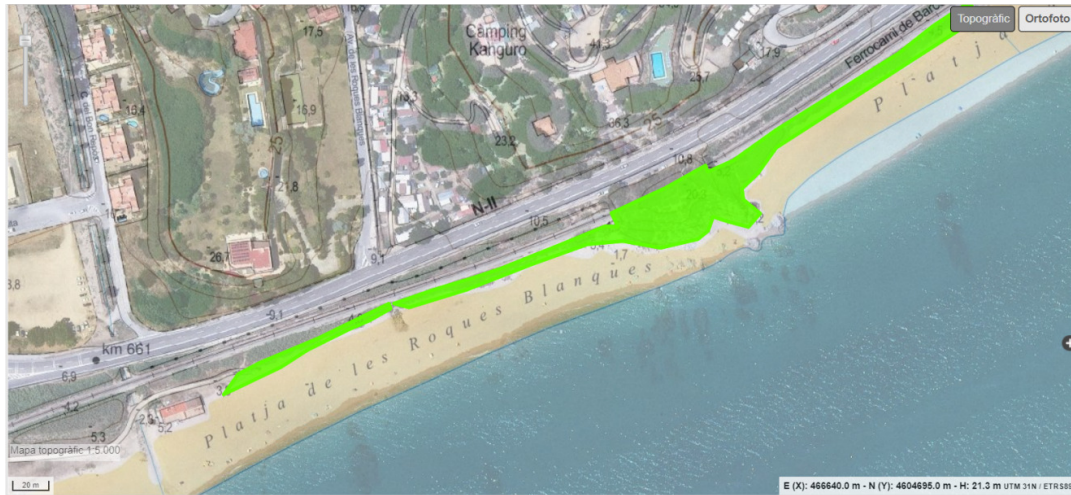
Plànol 2. Àmbit de naturalització de la platja de Roques Blanques.