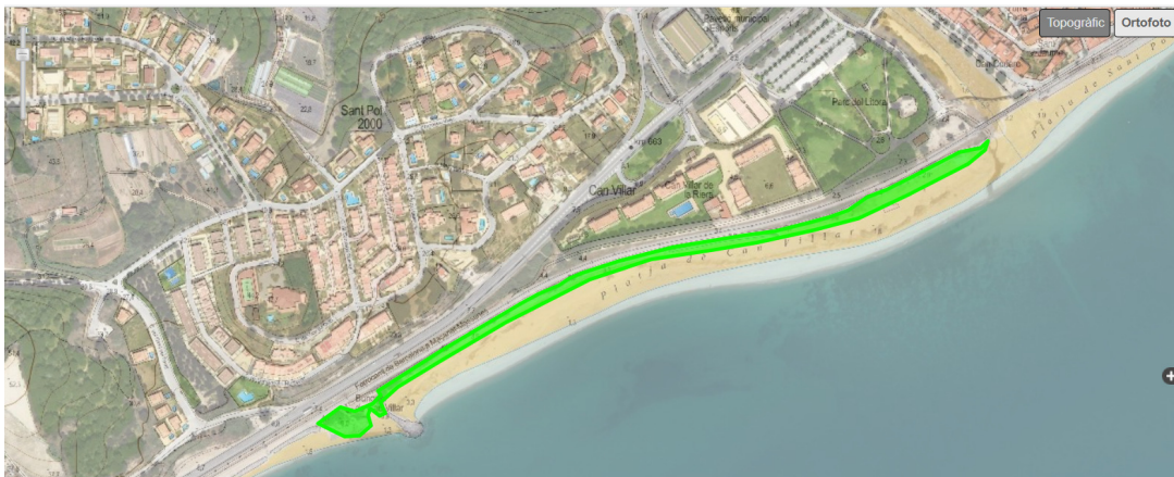
Plànol 4. Àmbit de naturalització de la platja de can Villar.

Per a descarregar una còpia d'aquest document consulti la següent pàgina web