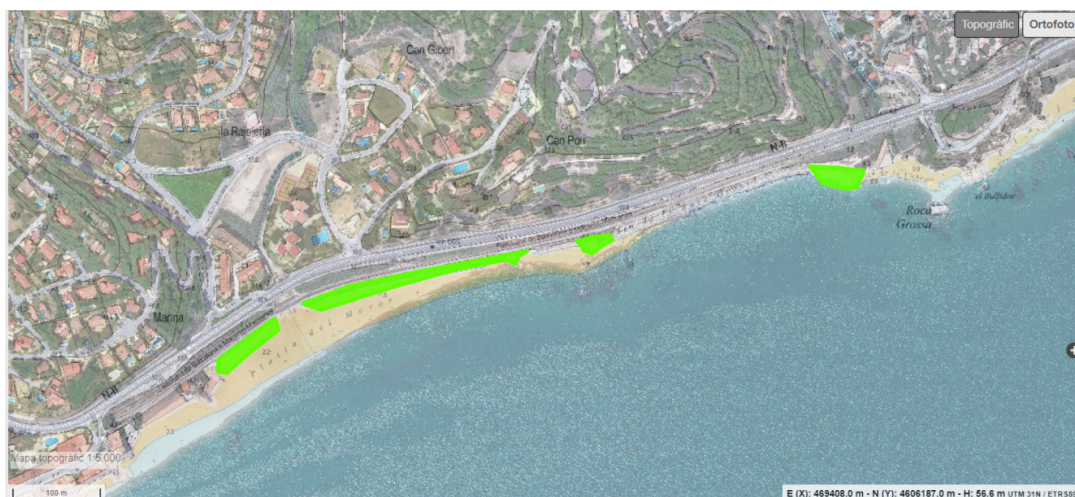
Plànol 5. Àmbit de naturalització de la platges del Morer i la Roca Grossa.

Per a descarregar una còpia d'aquest document consulti la següent pàgina web