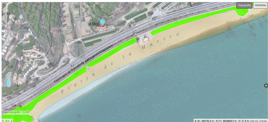
Plànol 3. Àmbit de naturalització de la platja de la Murtra.