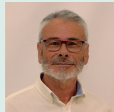
Josep Parada Platges, Habitatge, Hisenda, Salut, Consum, Gent Gran