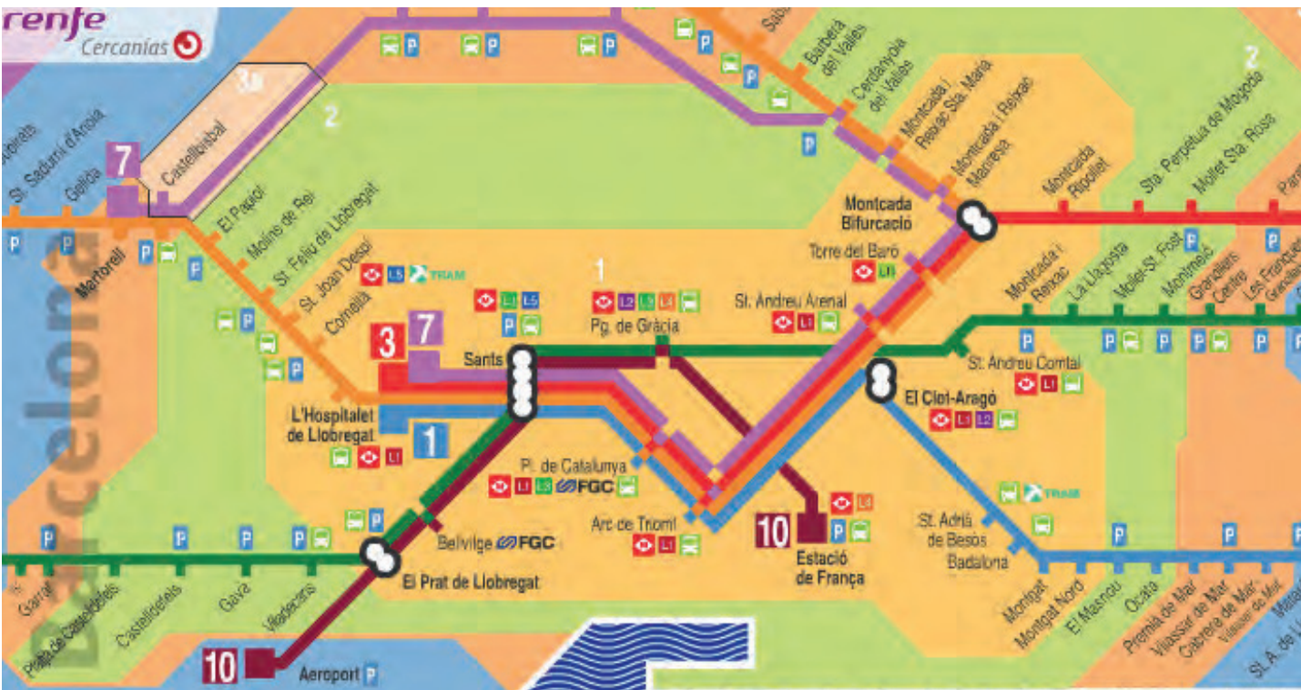
Plànols aportats per Fomento. De dalt a baix: 1.- Contempla la línia Blanes-Vilanova. 2.- La doble via arriba fins a Arenys. 3.- La C1 ja no va a l'aeroport.

Des que es va presentar el Pla de Rodalies les diferents reaccions han estat més aviat crítiques. Així, al Maresme s'hi troben a faltar molts dels compromisos adquirits, com la tant reclamada línia orbital.