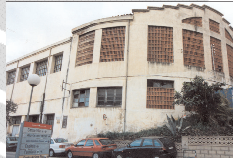
L'antiga fàbrica Sauleda, a l'esquerra, i el solar en l'actualitat, que funciona com a aparcament.