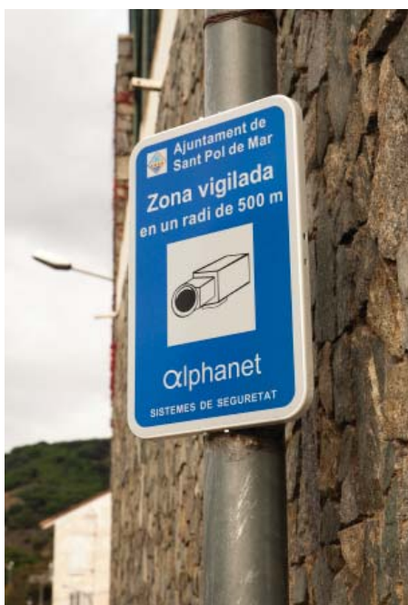
Les càmeres de seguretat estan instal·lades a les entrades del poble situades a l'Hotel i a les Quatre Carreteres.