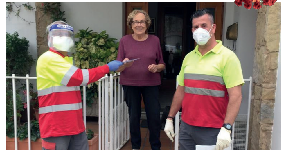
La Brigada municipal ha repartit les mascaretes a les llars santpolenques

Tanmateix, des de l'equip de govern se segueix fent una crida a tota la ciutadania per no abaixar la guàrdia