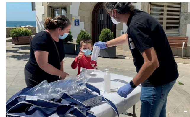
També s'han donat mascaretes als infants de la vila.